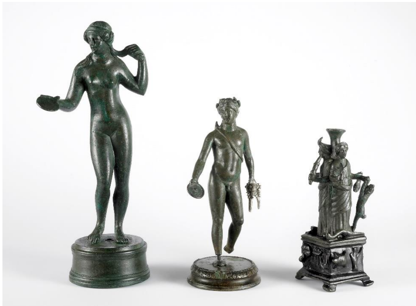
Les trois statuettes retrouvées sous le parking de la Duche : Vénus, Apollon, Hécate. Elles font entre 6 et 13 cm de hauteur. (Photo : Rémy Gindroz).

Malheureusement, avec le temps, très peu de ces grandes statues en bronze ont survécu. Comme elles étaient faites dans un mélange de métal très précieux, les statues ont souvent été détruites après un certain temps et ensuite refondues pour réutiliser leur bronze et fabriquer de plus petits objets en bronze (vaisselle, statuette, outils...).