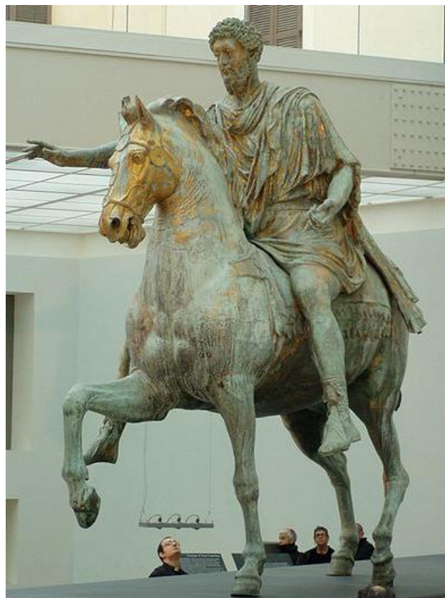
Statue équestre de l'empereur romain Marc-Aurèle. 2ème siècle après J.-C. Musées du Capitole, Rome.

Ces statues étaient en bronze. Le bronze est un mélange de métal (un alliage) qui était compliqué à fabriquer et surtout qui coûtait très cher. Ces statues avaient donc une grande valeur et devaient être précieuses.