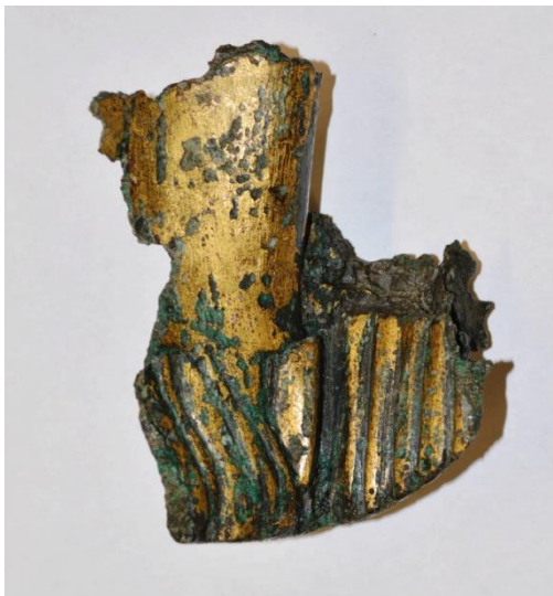
Fragment d'une sculpture en bronze retrouvé à Nyon

A Nyon, on a pu retrouver quelques petits fragments oubliés après la destruction de ces sculptures.