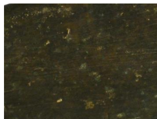
Exemple d'un fragment de bronze « cuiivé » à droite et d'un fragment de bronze « oxydé » à gauche